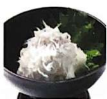
しらすおろし 278円(+税)