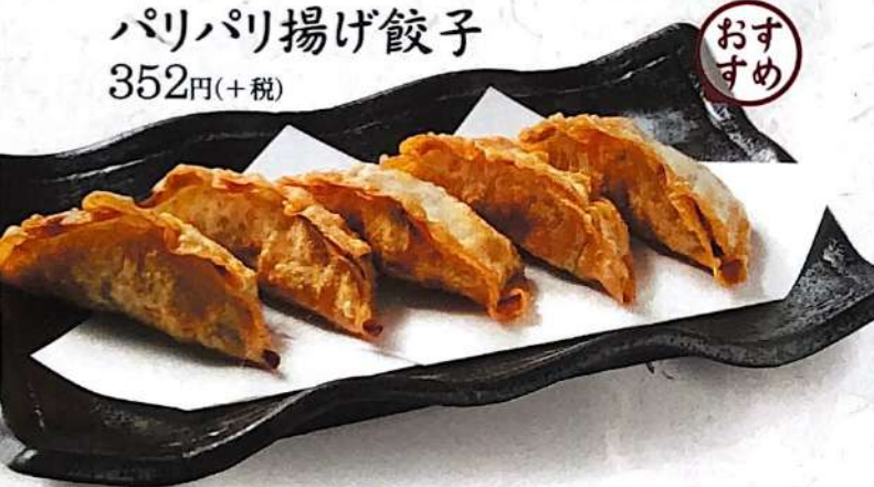
パリパリ揚げ餃子 352円(+税)