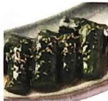
タタキきゅうり 297円(+税)