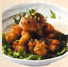
たこの唐揚げポン酢 445円(+税)