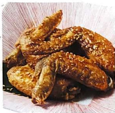
手羽先の唐揚げ 667円 (+税)