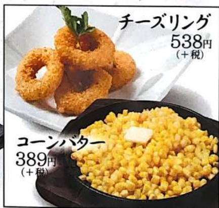
チーズリング 538円 (+税)