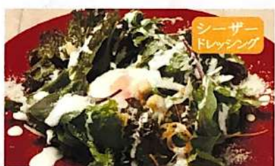
手作り豆腐サラダ 630円(+税)