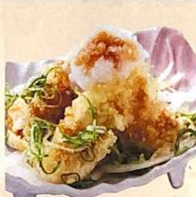
とり天おろしポン酢 389円(+税)