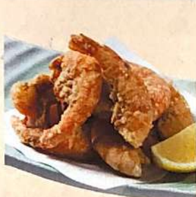
小えびの唐揚げ 389円(+税)