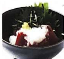
まぐろ山かけ 389円(+税)