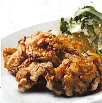
若どり唐揚げ 510円 (+税)