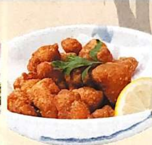
なんこつ唐揚げ 417円(+税)