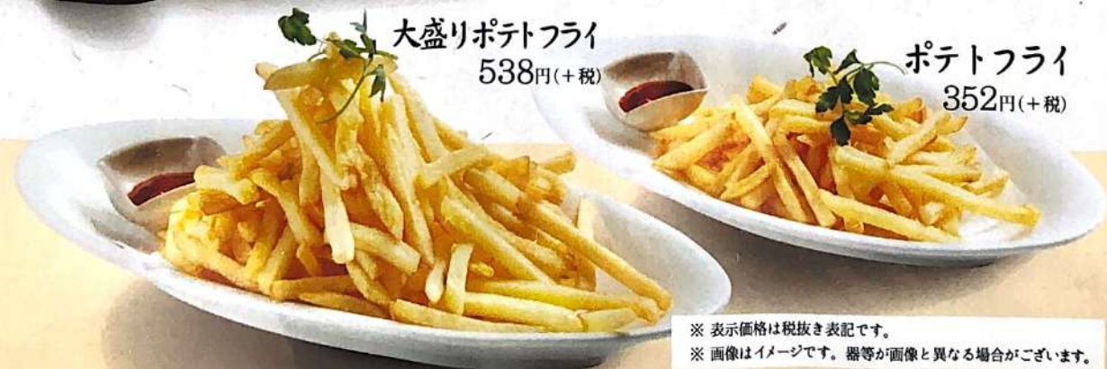
ポテトフライ 352円(+税)

※ 表示価格は税抜き表記です。 ※ 画像はイメージです。器等が画像と異なる場合がございます。